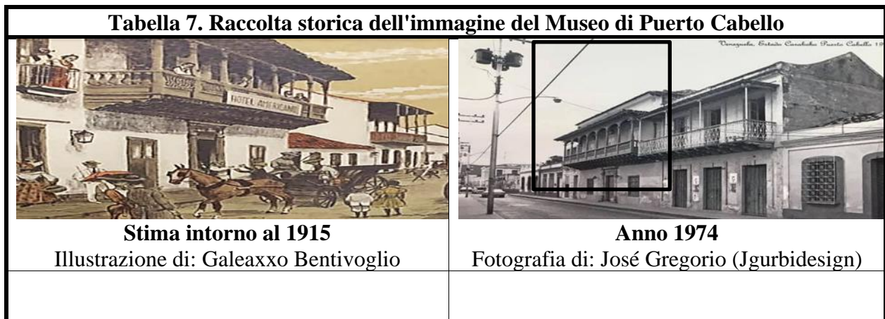
Tabella 7. Raccolta storica dell'immagine del Museo di Puerto Cabello