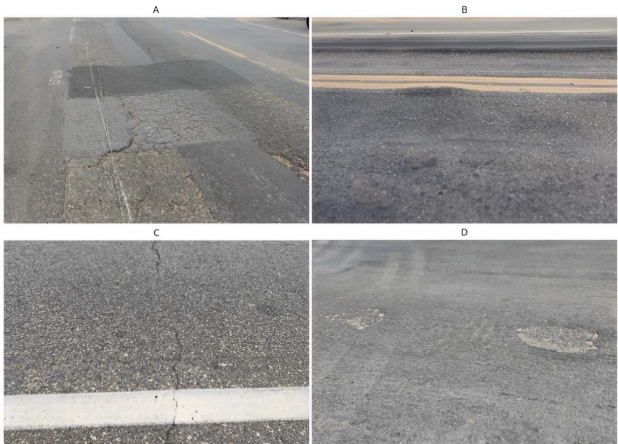
Figura 2 - Principales defectos encontrados en la BR-222: (a) parches y grietas cocodrilo (b) socavones (c) grietas transversales (d) baches y desgaste.

En relación con LVC, se observó que los segmentos seleccionados presentaron diferentes tipos de defectos como fisuras aisladas, fisuras de piel de caimán, socavones, ondulaciones y exudación, cuyo puntaje resultó en un ICPF que varía de 2 a 4 según Tab (3). Las secciones 3 y 4 tienen un IGGE alto, demostrando así su condición crítica respecto a defectos del tipo: baches y parches. La Figura 2 muestra los defectos encontrados en los tramos analizados de la Carretera BR-222.